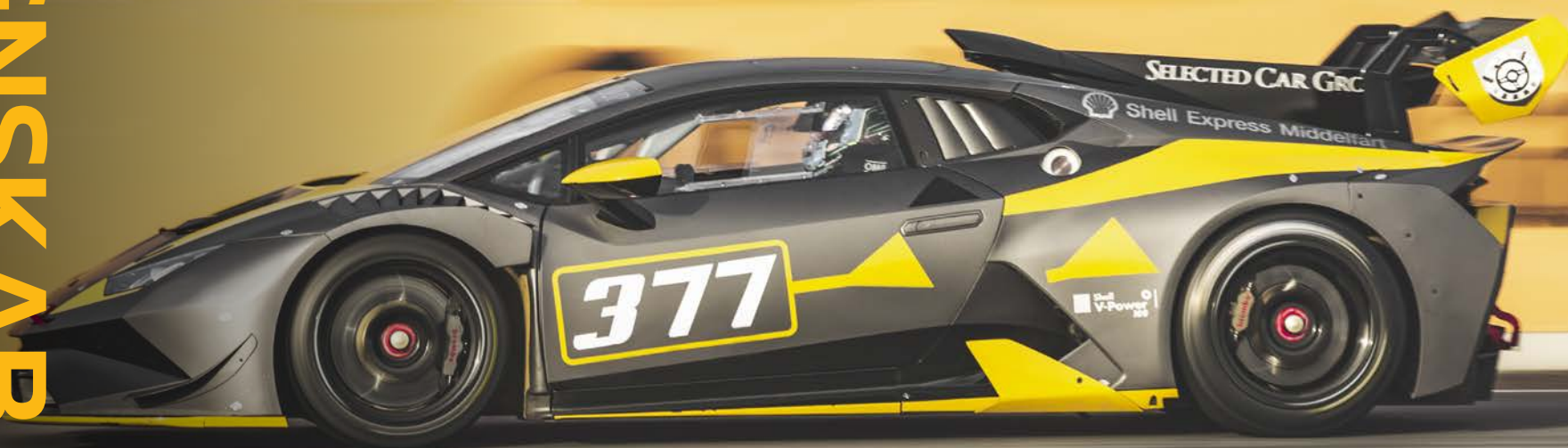
Selected Car Groups egen Lamborghini Huracán Super Trofeo Evo. Kørte i Special Saloon Car klassen på Jyllandsringen oktober 2018.