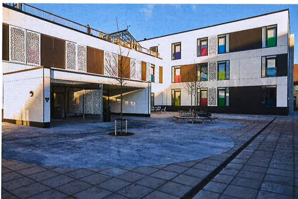
Tradium – Talent College – Jord, kloak og belægning

Årsrapporten er fremlagt og godkendt på selskabets ordinære generalforsamling den 26/4-2019