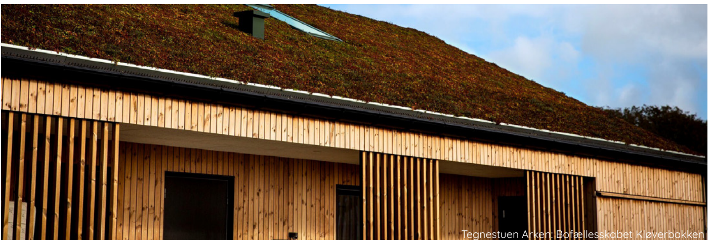
Tegnestuen Arken: Bofællesskabet Kløverbakken