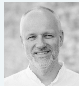
Torben Nielsen Arkitekt