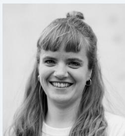
Mette Lind Arkitekt