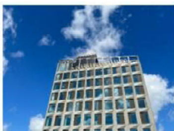
Afslutning af VVS-entreprisen på Høje Taastrups nye rådhus.