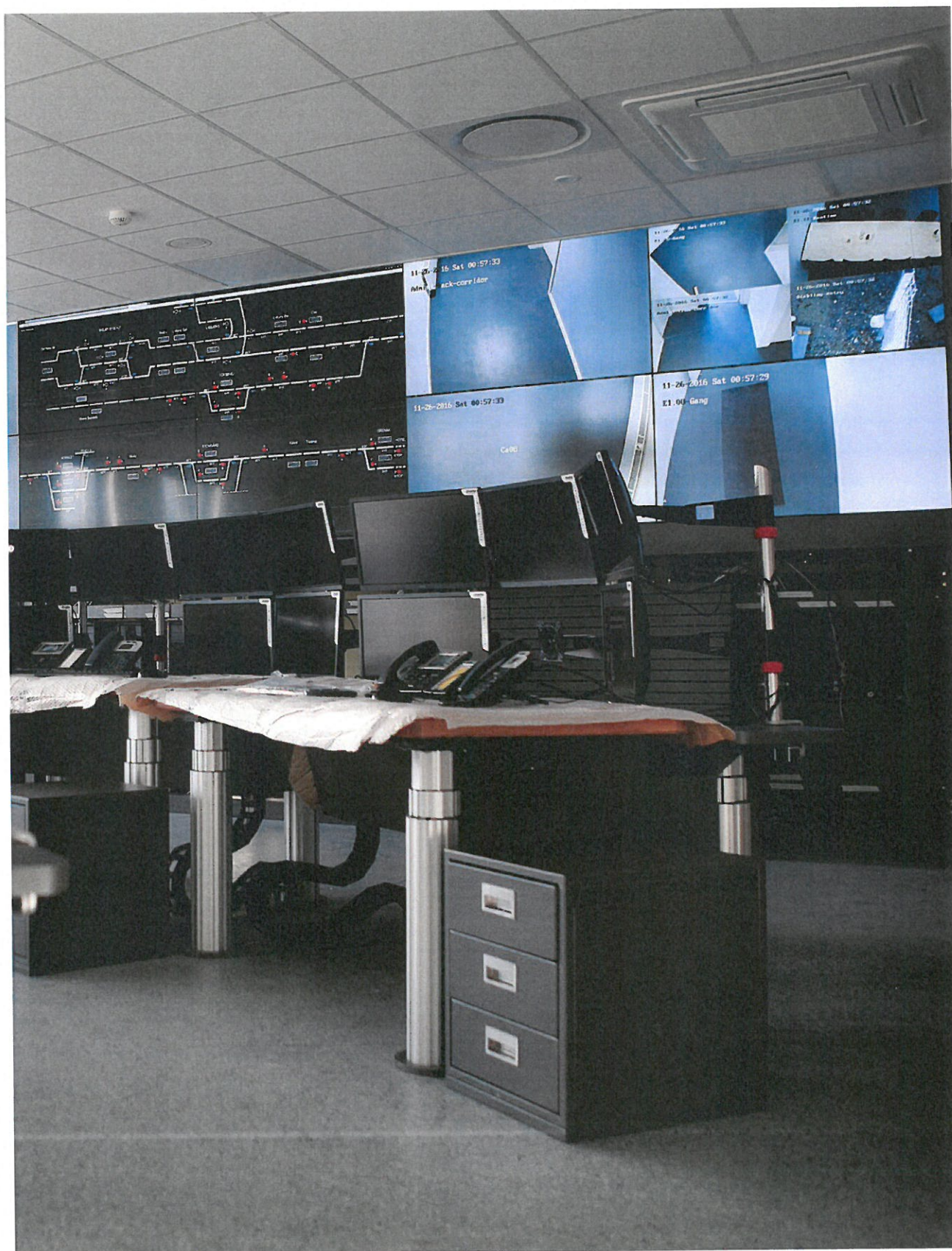
Midt i november 2016 flyttede Aarhus Letbane ind i det nye Trafik- og Servicecenter i banegraven. Ud over kontrolrummet her på billedet, indeholder centeret værksted, depot, vaskehal, opstillingsområde og kontorer.