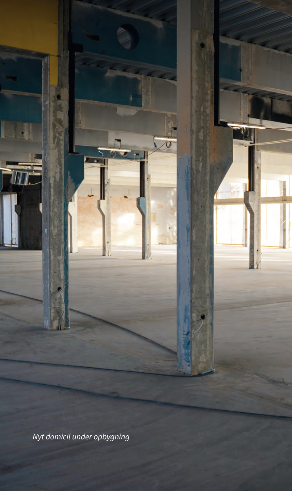
Nyt domicil under opbygning

større og mere eksklusive rammer for den fremtidige vækstrejse. Solid Leasing får større kontorlokaler, forbedrede klargøringsfaciliteter, bedre mulighed for fotografering og markedsføring, mulighed for udstilling af biler i to plan samt mulighed for at gennemføre op til fem separate afleveringer af biler på samme tid.