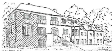
LENE HØJ LARSEN