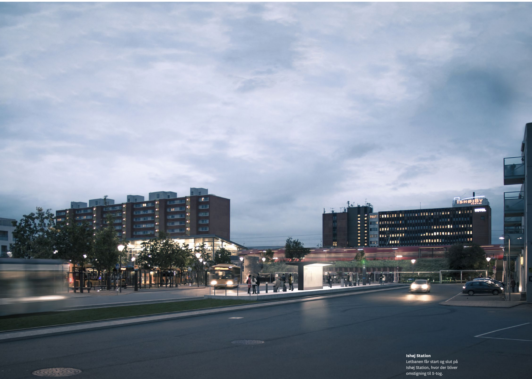
Ishøj Station Letbanen får start og slut på Ishøj Station, hvor der bliver omstigning til S-tog.