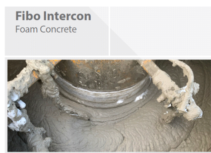
Fibo Intercon Foam Concrete

Fibo Intercon A/S has continued the development of unique solutions in close cooperation with our customers and partners. A cornerstone of this cooperation is a focus on digitalisation and sustainability.