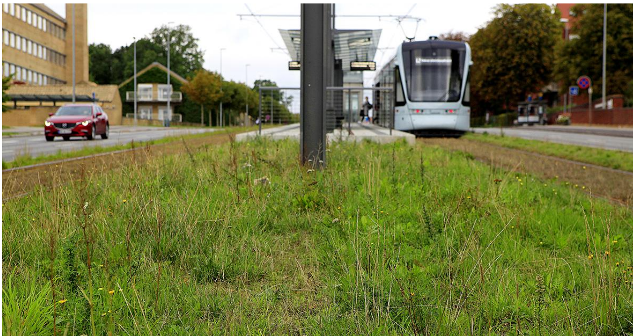
Aarhus Letbane er eldrevet og en vigtig del af Aarhus Kommunes målsætning om at gøre byen CO2-neutral i 2030.