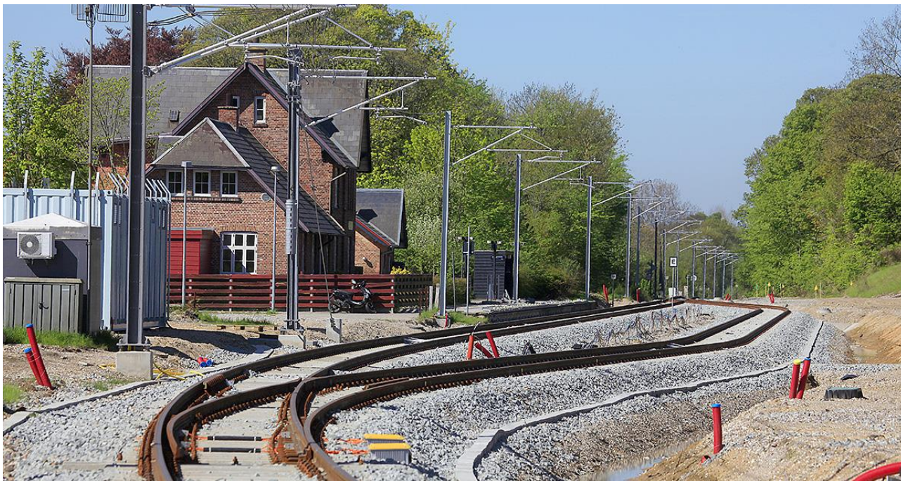
Krydsningssporet her ved Trustrup Station gør det muligt at øge antallet af afgange mellem Aarhus og Ryomgård.