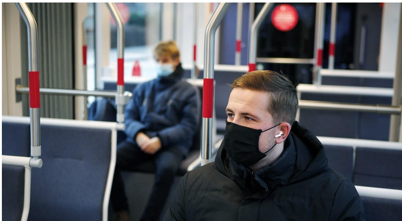
Mundbind og god afstand er blevet en del af Letbane passagerenes hverdag under Covid-19.

For passagerantallet har Covid-19 haft betydelige konsekvenser for Letbanen. Frygten for smitte, anbefalinger fra myndighederne om ikke at benytte kollektiv trafik, ændrede arbejdsvaner i form af hjemmeundervisning og hjemmearbejde samt ændrede transportvaner har givet en tilbagegang for hele den kollektive trafik på op til 40 procent. Ifølge Midttrafiks opgørelse kørte i alt 3,5 mio. passagerer med Letbanen i 2020 mod 4,7 mio. passagerer i 2019. Det er en tilbagegang for Letbanen på 25 procent.