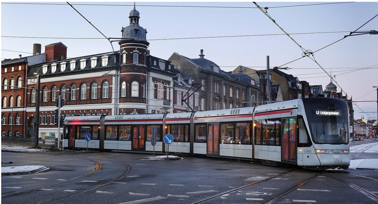
Aarhus Letbane er blevet en fast bestanddel af bybilledet i Aarhus – her i krydset ved Nørreport og Kystvejen.