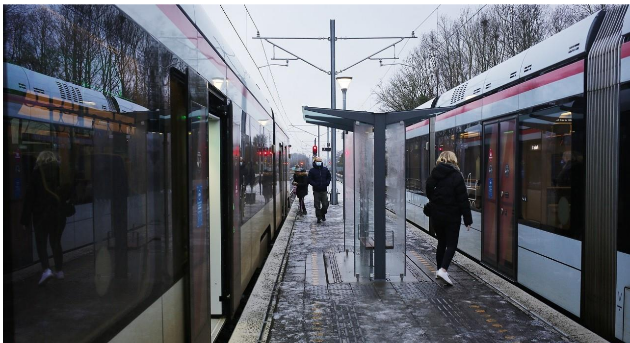
Passagerne på Djursland har fået kortere rejsetid mellem Aarhus H og Grenaa og bedre tid til togsift på Lystrup Station.

2. november 2020 blev hastigheden øget fra 75 til 100 kilometer i timen på strækningen mellem Ryomgård og Grenaa. For passagerne betyder det en reduceret rejsetid mellem Ryomgård og Grenaa på 3 minutter i begge retninger. Hele rejsetiden fra Aarhus H til Grenaa er reduceret med seks minutter, så den nu tager en time og 11 minutter. Turen den modsatte vej er dog to minutter længere.