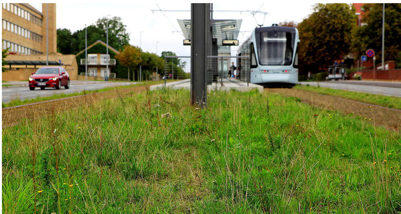
Aarhus Letbane er eldrevet og en vigtig del af Aarhus Kommunes målsætning om at gøre byen CO 2 -neutral i 2030.

Letbanetogene kører fra kl. 4.30 om morgenen til godt midnat hver dag. Kun om natten samles de i Trafik- og Servicecentret, hvor de serviceres, rengøres og repareres, hvis det er nødvendigt.