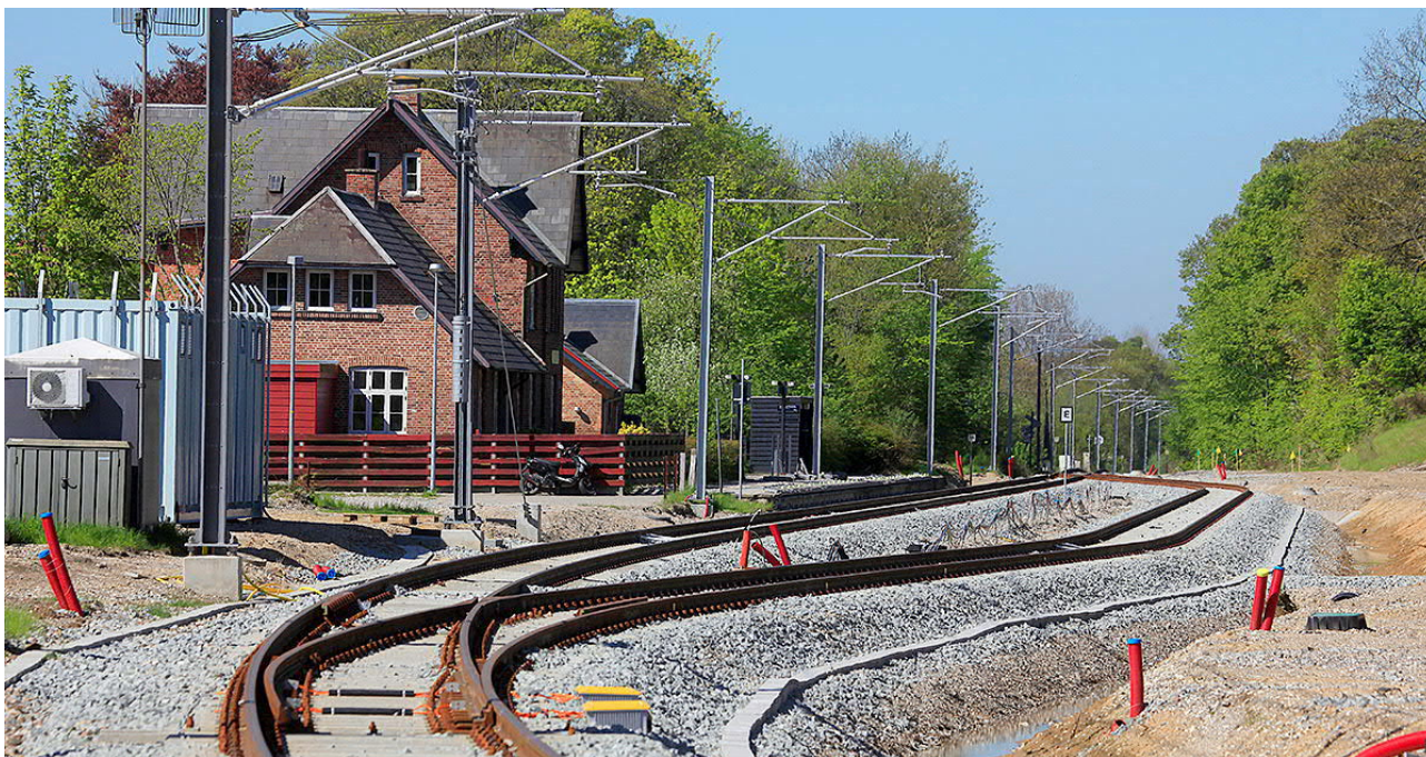
Krydsningssporet her ved Trustrup Station gør det muligt at øge antallet af afgange mellem Aarhus og Ryomgård.