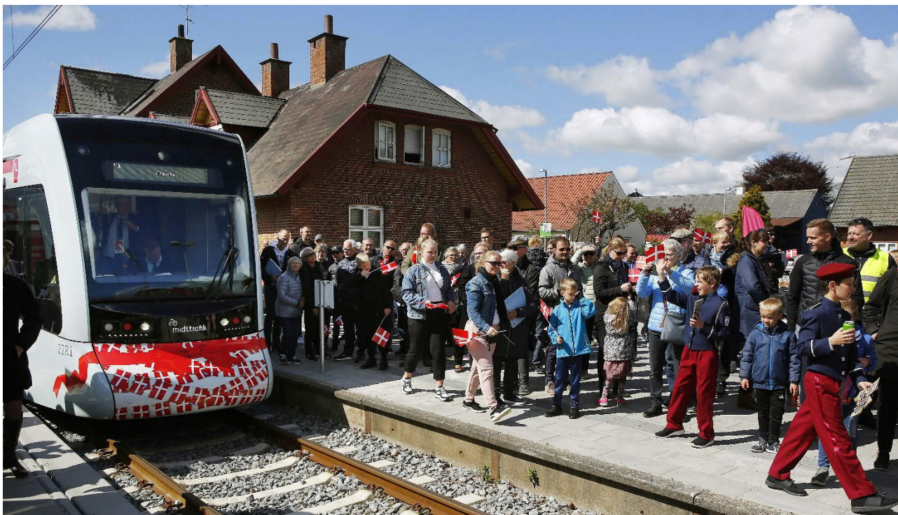
Søndag den 12. maj var publikum mødt talstærkt op for at fejre åbningen af strækningen til Grenaa.