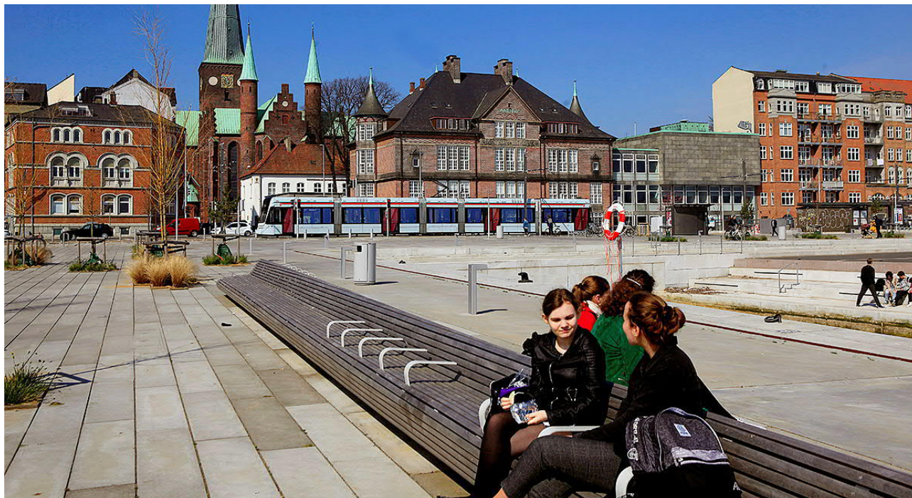
I 2019 blev Aarhus Letbane en fast bestanddel af bybilledet i Aarhus – her på Havnepladsen foran Katedralskolen.