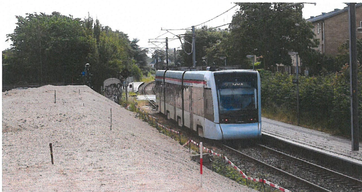
Arbejdet på Vestre Strand Allé skrider planmæssigt frem og gør det muligt at øge med kvartersdrift til Hornslet i myldretiden senere på året.

Egenkapitalen påvirkes af ovenstående forventning om et negativt resultat. Det bevirker at egenkapitalen i 2022 som forventet øger sin negative værdi. Dette skyldes at selskabets økonomiske aktivitet i stort omfang består i at vedligeholde og ned- og afskrive på meget store materielle anlægsaktiver uden at have de indtægter der er forbundet med aktivets drift hhv. indtægter der overstiger ned- og afskrivningerne. Dette kombineret med en givet fast egenkapitalstørrelse fastlagt ved selskabets etablering efter aftale med Staten, Region Midt og Aarhus Kommune, vil lede til en stigende negativ egenkapital i selskabet.