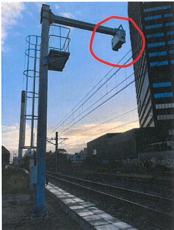
Pantoinspect-systemet ved Aarhus H. Selve scanneren ses i den røde boble.