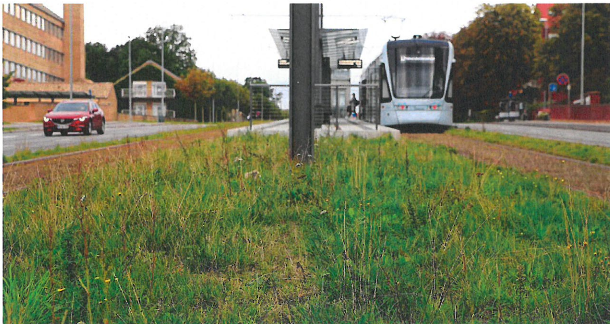
Aarhus Letbane er eldrevet og en vigtig del af Aarhus Kommunes målsætning om at gøre byen CO2-neutral i 2030.

Letbanetogene kører fra kl. 4.30 om morgenen til godt midnat hver dag. Kun om natten samles de i Trafik- og Servicecentret, hvor de serviceres, rengøres og repareres, hvis det er nødvendigt.