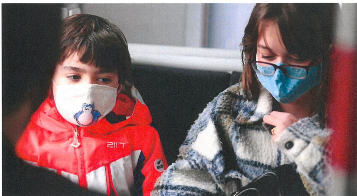
Mundbind og god afstand blev en del af Letbane passagerenes hverdag under Covid-19.

For passagerantallet har Covid-19 haft betydelige konsekvenser for Letbanen. Frygten for smitte, anbefalinger fra myndighederne om ikke at benytte kollektiv trafik, ændrede arbejdsvaner i form af hjemmeundervisning og hjemmearbejde samt ændrede transportvaner har givet en tilbagegang for hele den kollektive trafik på op til 40 procent. Ifølge Midttrafiks opgørelse kørte i alt 4,0 mio. passagerer med Letbanen i 2021 mod 4,7 mio. passagerer i 2019 og 3,5 mio. i 2020. Det er en tilbagegang for Letbanen på 15 procent siden 2019, men en fremgang på 14 procent siden 2020.