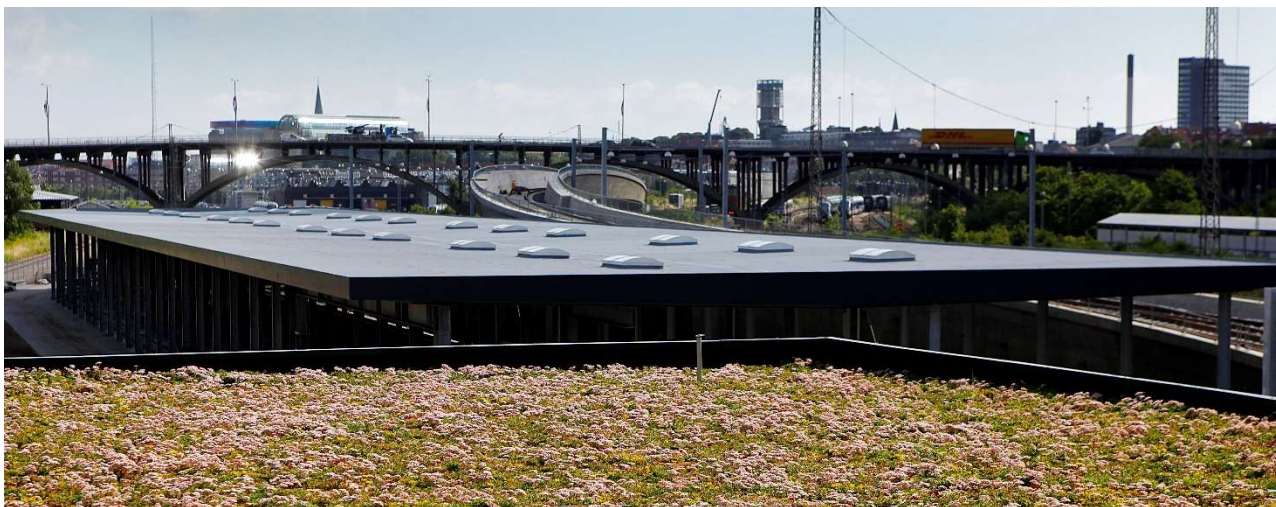
Aarhus Letbane er eldrevet og en vigtig del af Aarhus Kommunes målsætning om at gøre byen CO2-neutral i 2030.