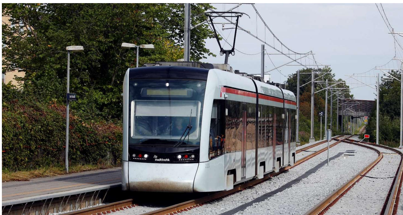
Ved udgangen af første kvartal stod Vestre Strandallé færdig og i august trådte den nye køreplan med kvartersdrift til Hornslet i myldretiden i kraft.

Egenkapitalen påvirkes af ovenstående forventning om et negativt resultat. Det bevirker at egenkapitalen i 2023 forventes at øge sin negative værdi. Dette skyldes at selskabets økonomiske aktivitet i stort omfang består i at vedligeholde og ned- og afskrive på meget store materielle anlægsaktiver uden at have de indtægter der er forbundet med aktivets drift hhv. indtægter der overstiger ned- og afskrivningerne. Dette kombineret med en givet fast egenkapitalstørrelse fastlagt ved selskabets etablering efter aftale med Staten, Region Midt og Aarhus Kommune, vil lede til en stigende negativ egenkapital i selskabet.