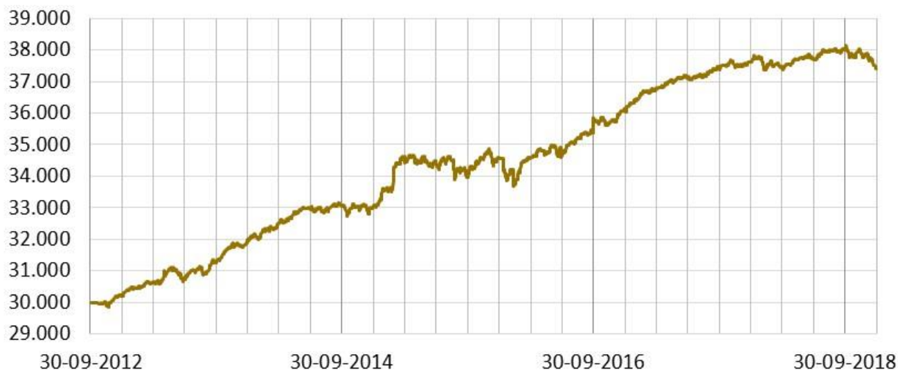
Figur 1: Daglig indre værdi for Investeringsselskabet Artha Safe A/S fra oktober 2012.

Selskabets indre værdi pr. aktie blev i 2018 reduceret fra 37.601 kr. primo til 37.396 kr. ultimo 2018 svarende til et fald på 0,55 %. Bemærk at primokursen er nedjusteret med en faktor 10 som følge af, at hver aktionær i maj 2018 fik 10-doblet sin aktiebeholdning via en nedsættelse af stk. størrelsen på Selskabets aktier. Den indre værdi opgøres dagligt som led i selskabets risikostyring samt til brug for handel i selskabets aktier, jf. nedenfor. Den foreløbige indre værdi ultimo 2018 opgjort i Faktaarket udsendt primo 2019 var 37.398 kr. Der er således god overensstemmelse mellem den daglige opgørelse og den reviderede opgørelse pr. ultimo 2018, idet afvigelsen er på under 0,01%.