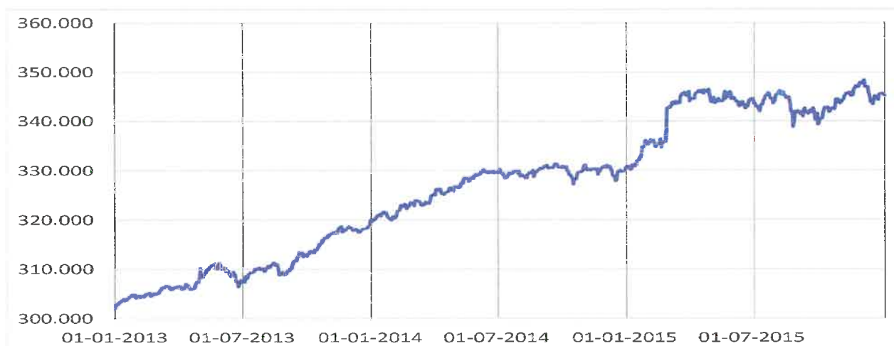
Figur 1: Daglig indre værdi for Investeringsselskabet Artha Safe A/S fra 2013-2015.

Alt i alt er Selskabets omkostningsprocent lidt højere i 2015 end i 2014. Dette skyldes alene de forøgede administrative byrder ved indførelse af FAIF-lovgivningen, idet det resultatafhængige gebyr er nedsat fra 5% til 2,5% af afkastet fra og med 2015.