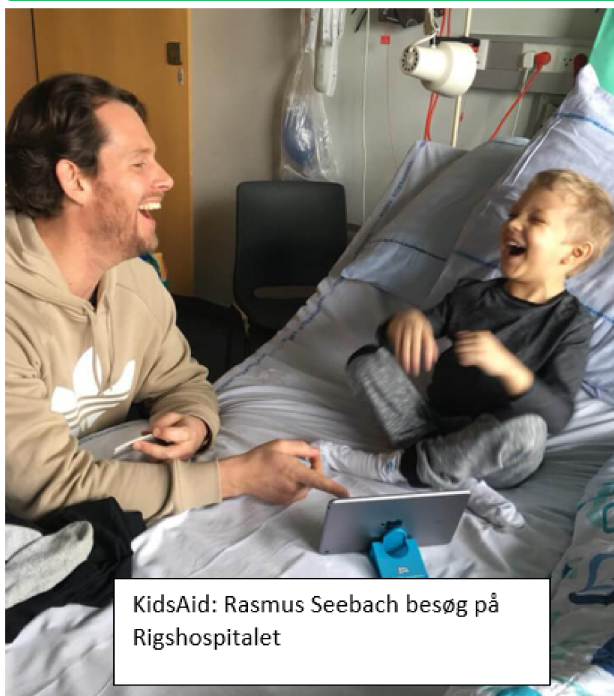
KidsAid: Rasmus Seebach besøg på Rigshospitalet

KidsAids primære formål er at skabe Unikke Oplevelser for syge og sårbare børn og unge i Danmark.