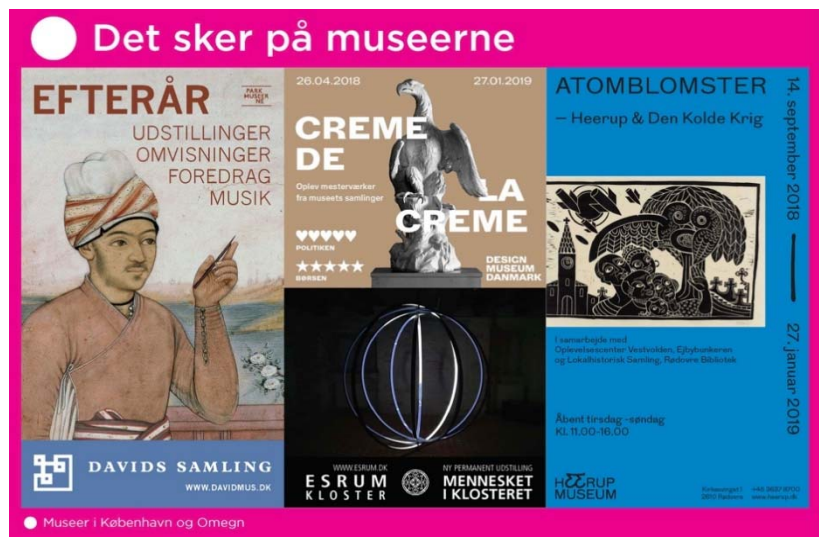
Fælles annonce bragt i Politiken 24. august 2018

Museer i København og Omegn har siden 2016 administreret profilen copenhagen_museums på Instagram, hvor vi ugentligt reposter indhold fra medlemmerne og løbende bringer nyheder fra foreningen.