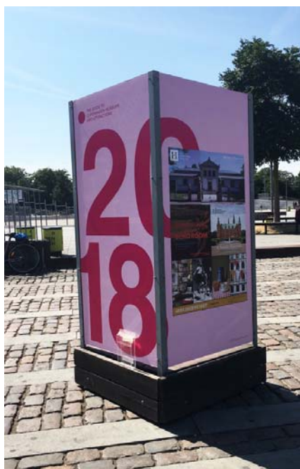
Museumspylon ved Israels Plads uge 30 og 31 2018

Af andre opgaver fra 2018 kan nævnes 1) Færdiggørelsen af evaluering af programmet ”MADE by the Sydney Opera” for KADK, Bikubenfonden og Den Obelske Familiefond, som ønskede en evaluering af udvekslingsprogrammet MADE samt en minikonference på bagkanten af denne. 2) evaluering af ”Årets Reumert” for Bikubenfonden som resulterede i en større evalueringsrapport. 3) Produktion af ”Anti-Distortion” en række mini-events under festivalen Distortion for folk, som ikke bryder sig om Distortion.