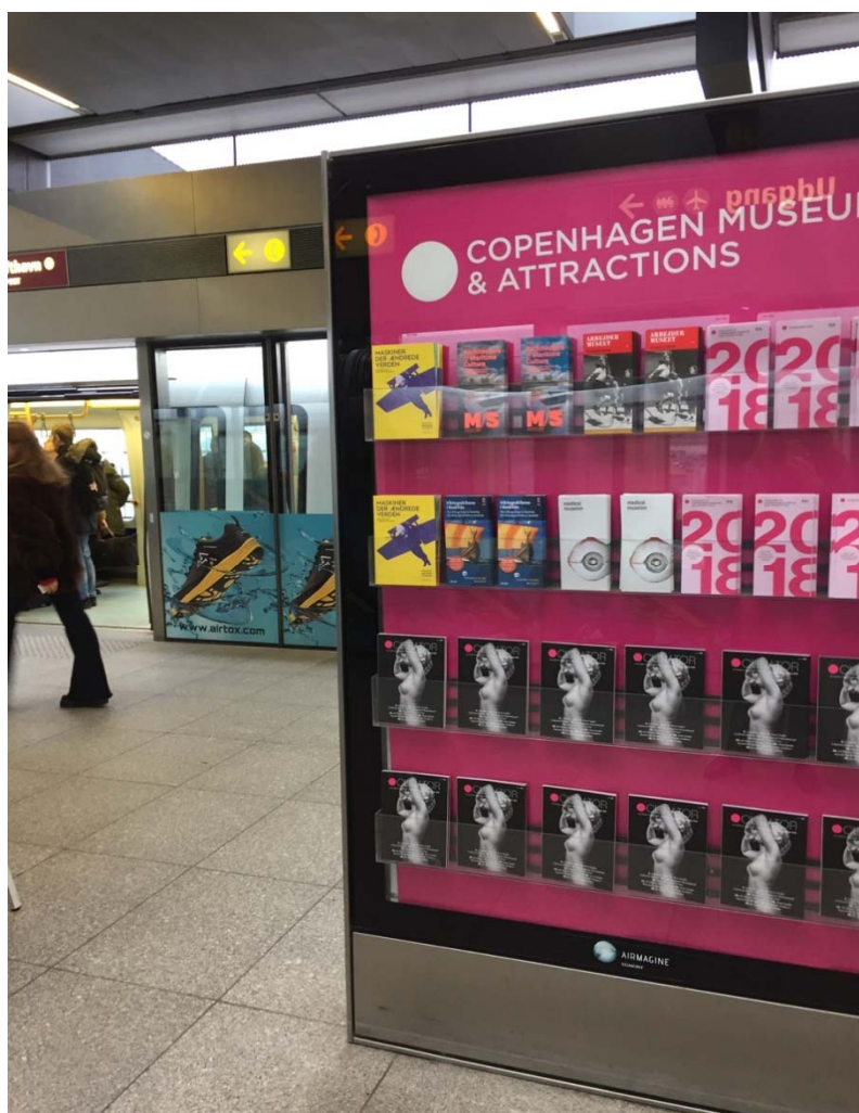
Museumsguides og Curator I Københavns Lufthavn

1. maj udkom årets første udgave af foreningens engelske turistmagasin Curator i 25.000 eksemplarer.