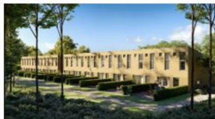
Mariedalsvej 3, Brabrand. 13 rækkehuse til salg.

Vi kan igen i år glæde os over samarbejdet med vores rådgivere, der gør det muligt at håndtere vore projekter smidigt og effektivt. Administrationen af vore projekter er udliciteret, og vi har i dag et tæt og godt samarbejde med en ekstern bogholder på deltid. Dermed lever vi op til vores målsætning om fleksibilitet og en flad struktur, alt baseret på erfaring, sund fornuft og god forretningsskik. Vi har ikke oplevet en væsentlig påvirkning af Covid-19 situationen.