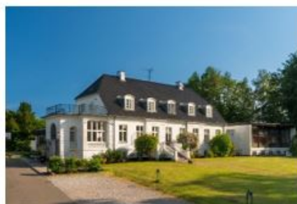
Vejlesøvej 41, Holte hvor Holte-Hus efterskole lejer ejendommen frem til aug. 2022.