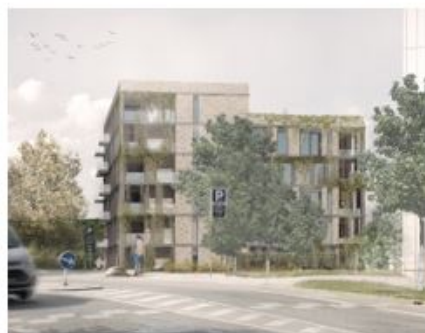
Bernhard Bangs Allé 29, Frederiksberg. 31 mindre lejligheder, der er udlejet siden april 2018.