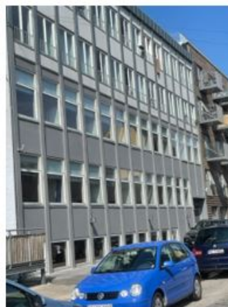
Svanevej 4, 2400 København – 48 kollegieværelser