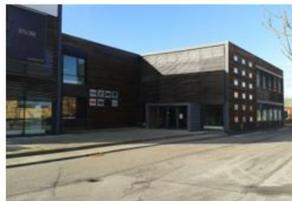
Islevdalvej 98 der i dag rummer 3 erhvervslejerne: Kärcher, Stila og Velfac