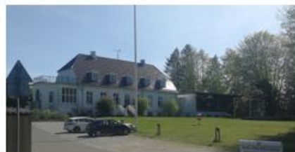
Holte-Hus Efterskole på Vejlsøvej 41, Holte, hvor der arbejdes med ny lokalplan