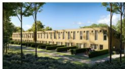
Mariedalsvej 3, Brabrand. 13 rækkehuse til salg, hvor de 10 er solgt og resten udlejet

Vi kan igen i år glæde os over samarbejdet med vores rådgivere, der gør det muligt at håndtere vore projekter smidigt og effektivt. Administrationen af vore projekter er udliciteret, og vi har i dag et tæt og godt samarbejde med en ekstern bogholder på deltid. Dermed lever vi op til vores målsætning om fleksibilitet og en flad struktur, alt baseret på erfaring, sund fornuft og god forretningsskik.