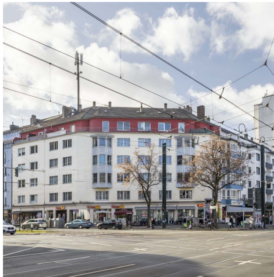
Dorotheenstrasse 1-3, Düsseldorf

Årsrapporten er fremlagt og godkendt på selskabets ordinære generalforsamling den 20/03 2024