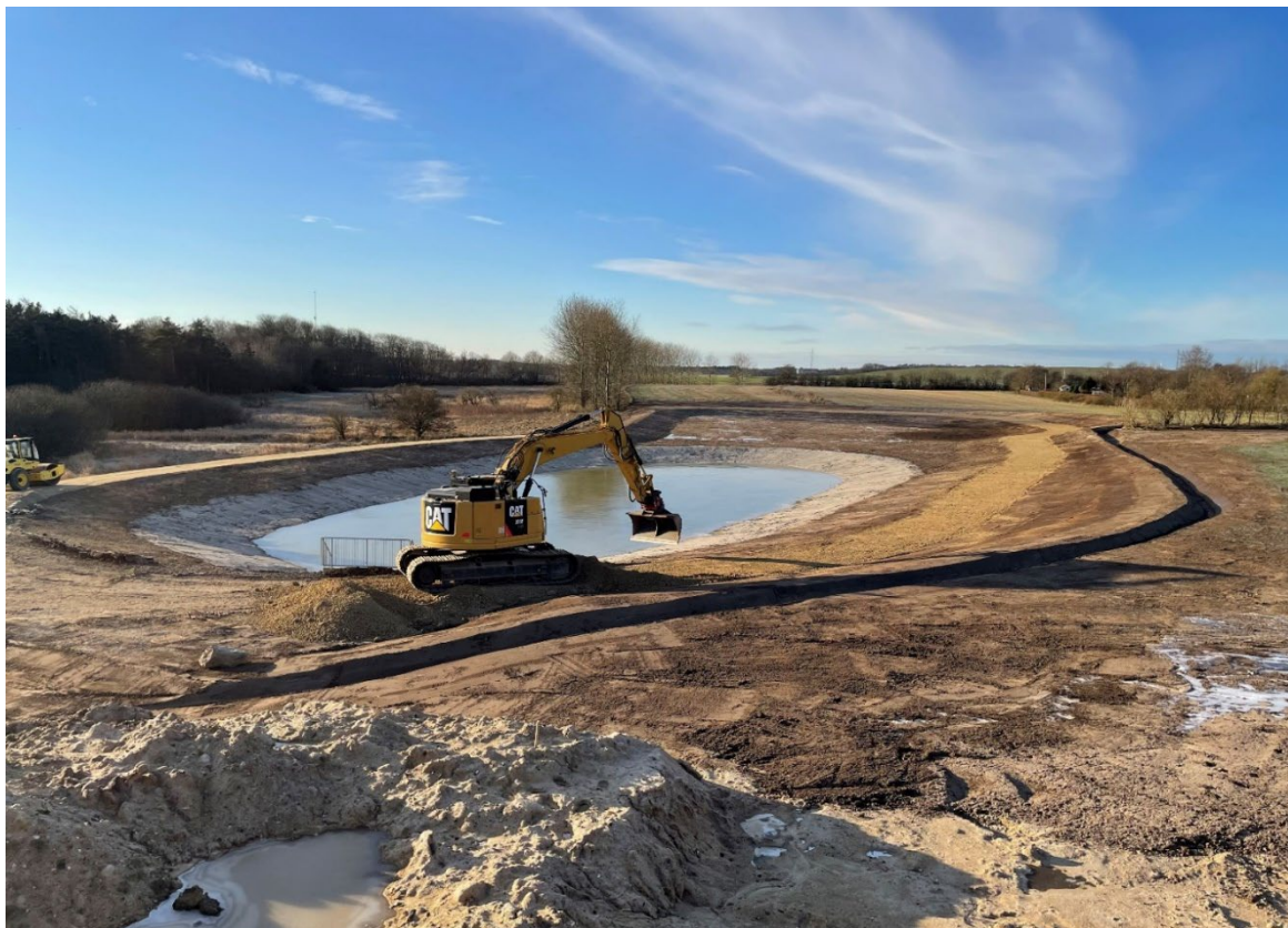
Regnvandsbassin under etablering syd for Holstebrovej

Formålet med at etablere regnvandsbassiner på afløb fra bl.a. veje og parkeringspladser er, at reducere oversvømmelser og forbedre vandkvaliteten ved at opsamle og filtrere regnvandet, før det når recipienter som eks. mindre vandløb. Dette bidrager til at mindske erosion, samtidig med at den mindre forurening skaber bedre betingelser for livet i vandløbene.