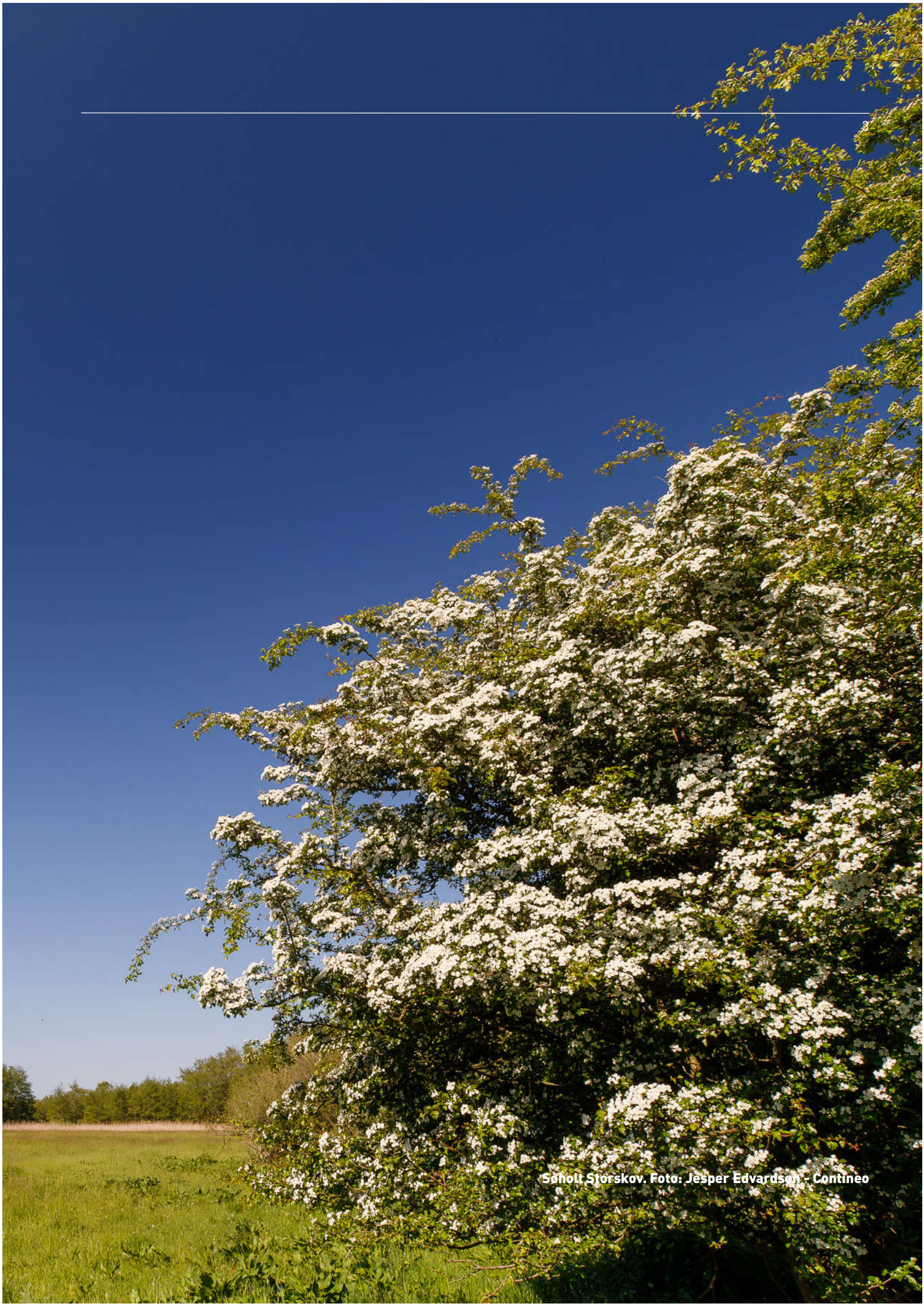
Såholt Storskov.