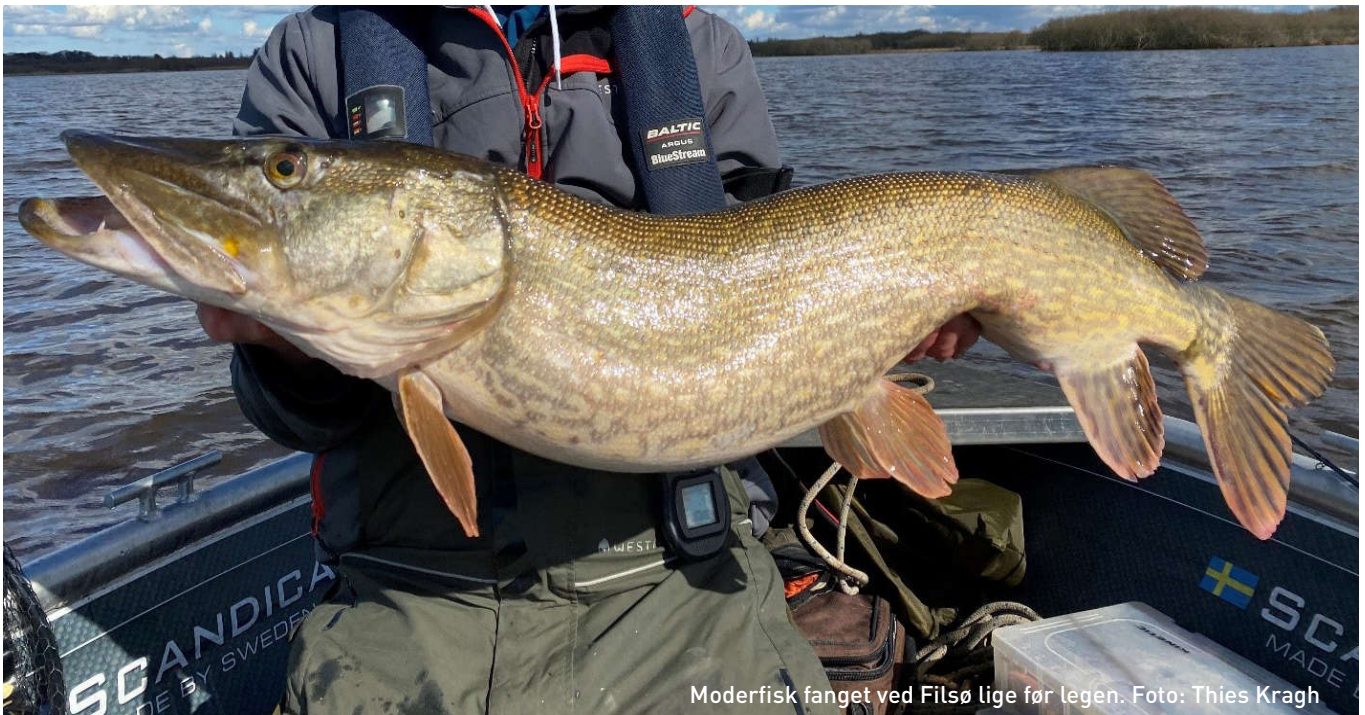
Moderfisk fanget ved Filsø lige før legen.

med Varde Kommune og den lokale Landboforening gennemført en oplandsanalyse, der kortlægger og afgrænser, hvor i oplandet uomsat organisk materiale kommer fra. En løsning kunne være at lade dræne fra de mest belastende områder udmunde i et sumpet område i stedet for direkte i søen. Fonden afventer nu et udspil fra Varde Kommune, som er i dialog med landboforeningen.