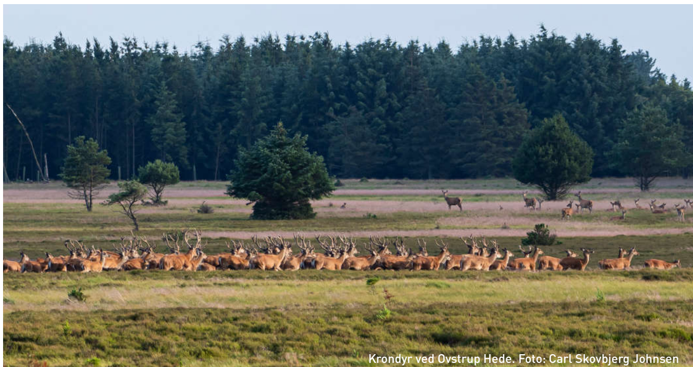
Krondyr ved Ovstrup Hede.