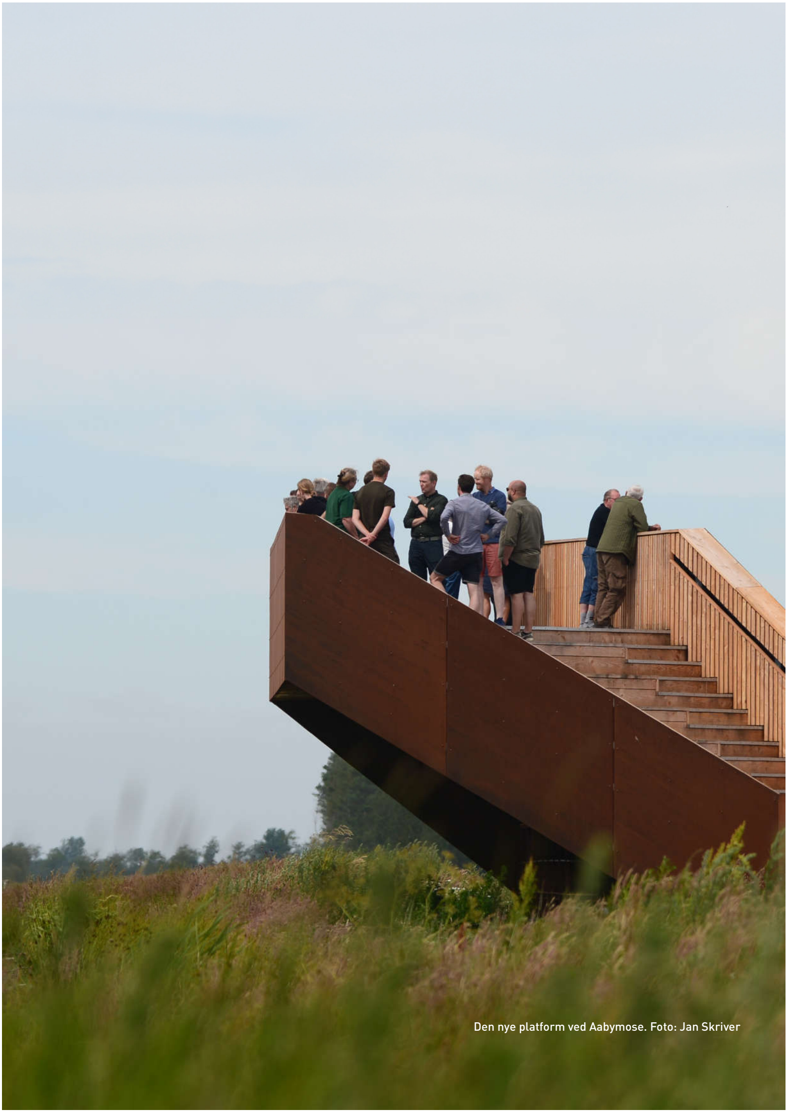
Den nye platform ved Aabymose.