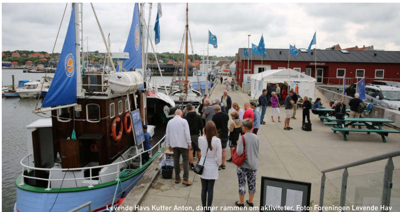
Levende Havs Kutter Anton, danner rammen om aktiviteter.

Naturfonden opfylder formålet dels ved støtte til eksterne projekter og dels ved erhvervelse, etablering, genopretning, monitorering og drift af egne naturområder i Danmark.