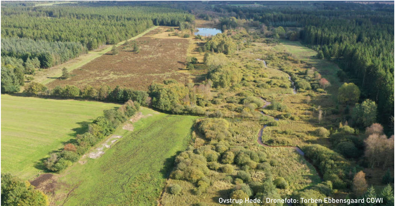
Ovstrup Hede.

landene omkring Østersøen i et seks-årigt EU LIFE-projekt, der skal klarlægge, hvor de mest sårbare habitater er ift. risikofaktorer som fødemængde- og kvalitet, fiskeri, bifangst og undervandsstøj. Bestanden overvåges samtidigt for at kortlægge de mest sårbare habitater og perioder. På den måde vil projektet frembringe en holistisk vurdering af artens status og de konkrete forvaltningstiltag, der skal sikre populationens overlevelse.