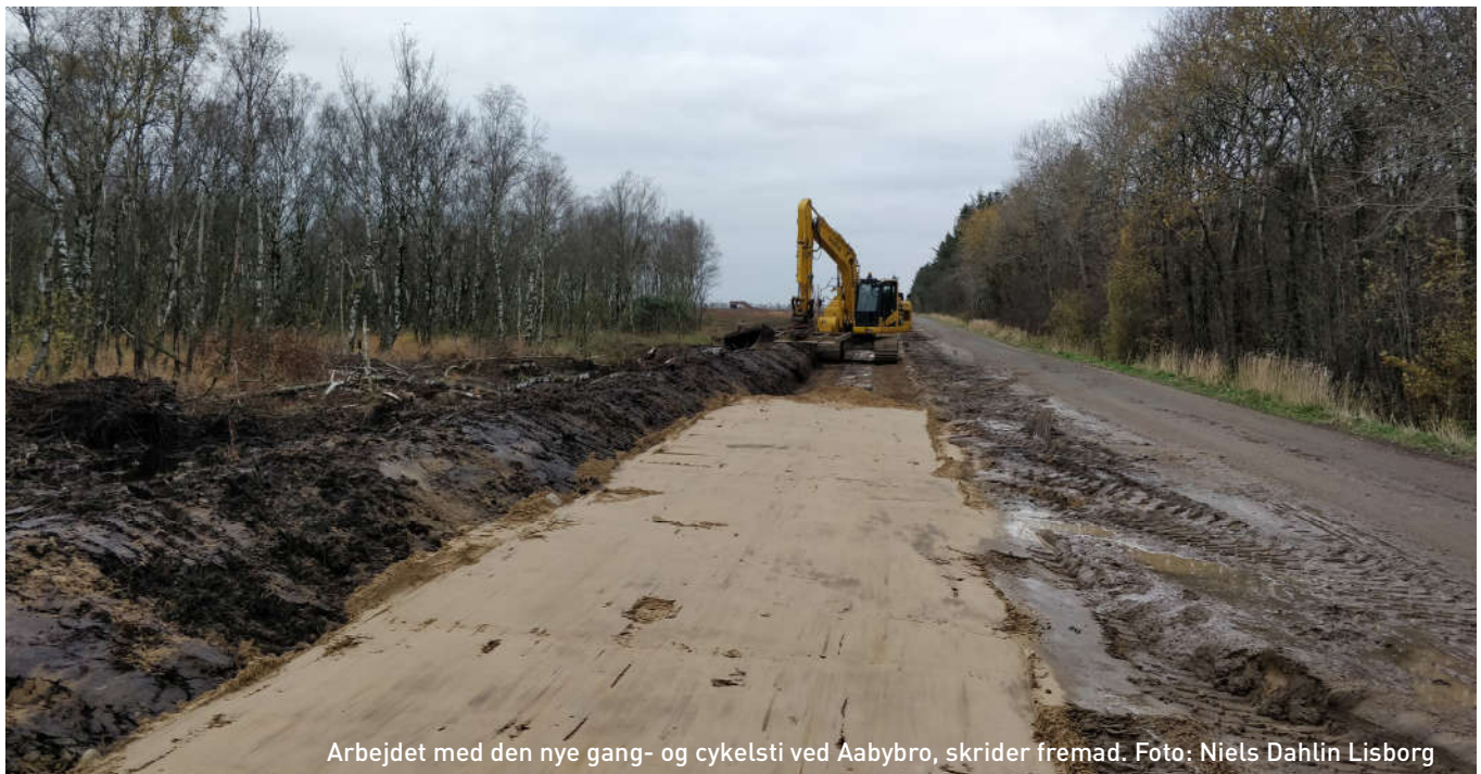
Arbejdet med den nye gang- og cykelsti ved Aabybro, skrider fremad.