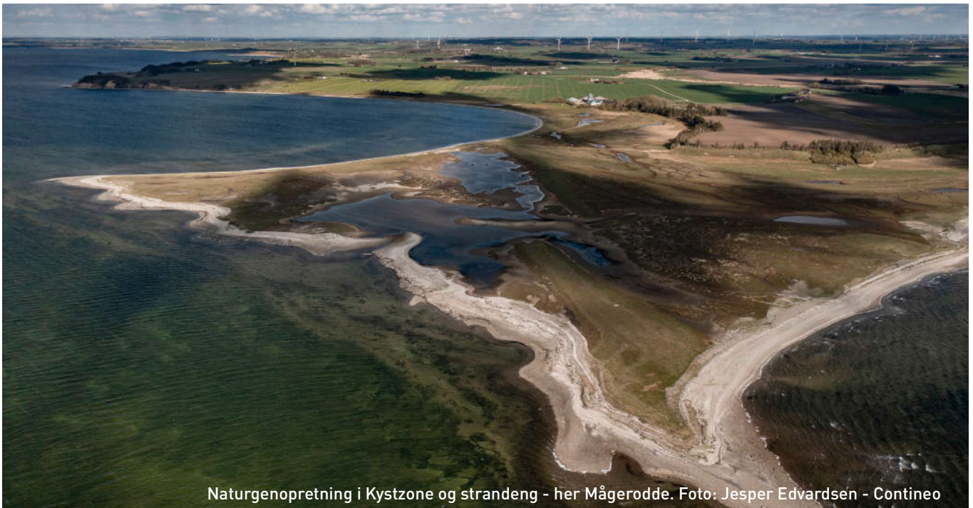
Naturgenopretning i Kystzone og strandeng - her Mågerodde.