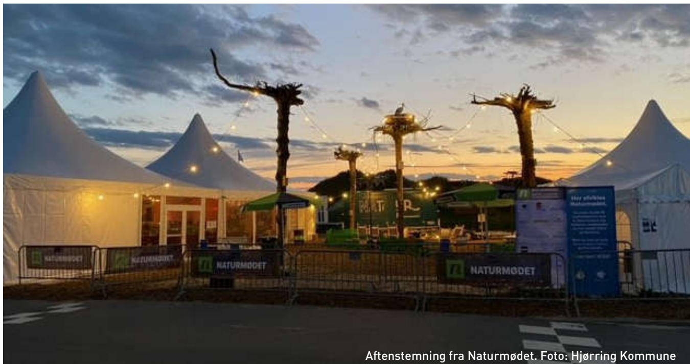
Aftenstemning fra Naturmødet.

med henblik på indførelse af internationale standarder for overvågning af natflyvende sommerfugle.