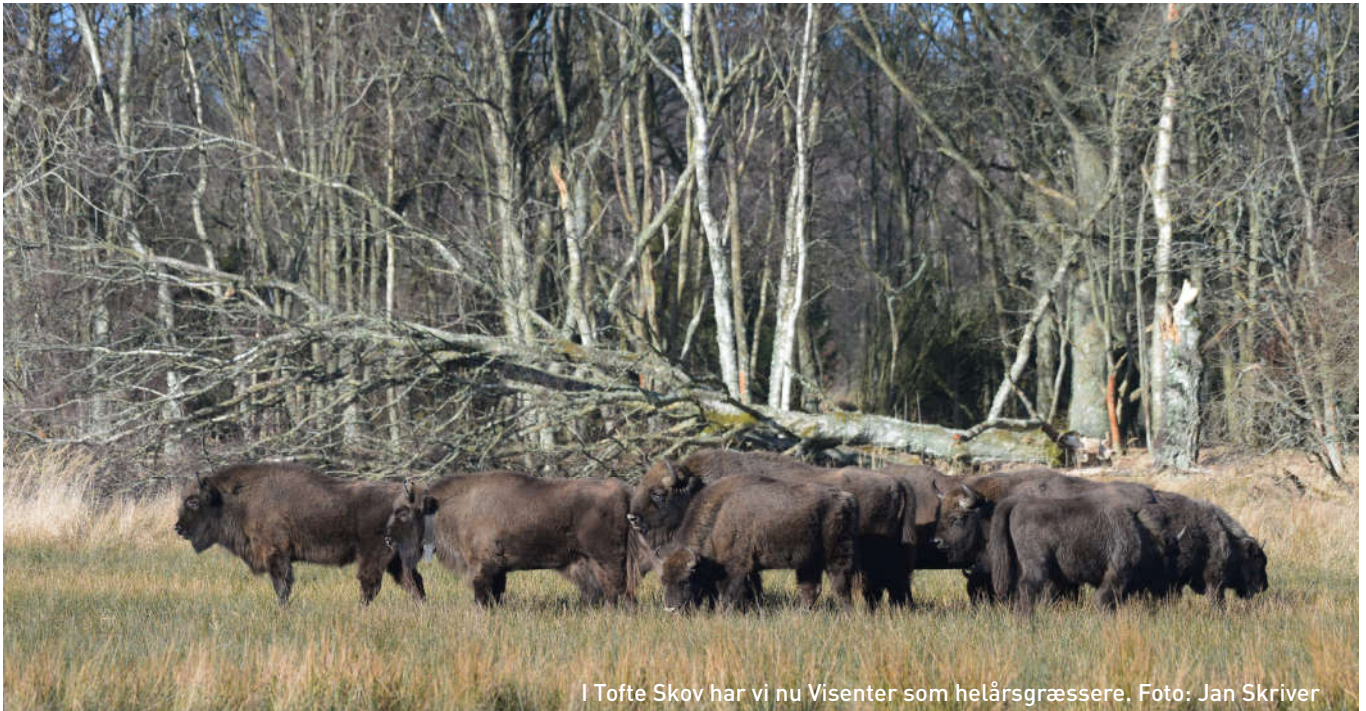
I Tofte Skov har vi Visenter som helårsgræssere.