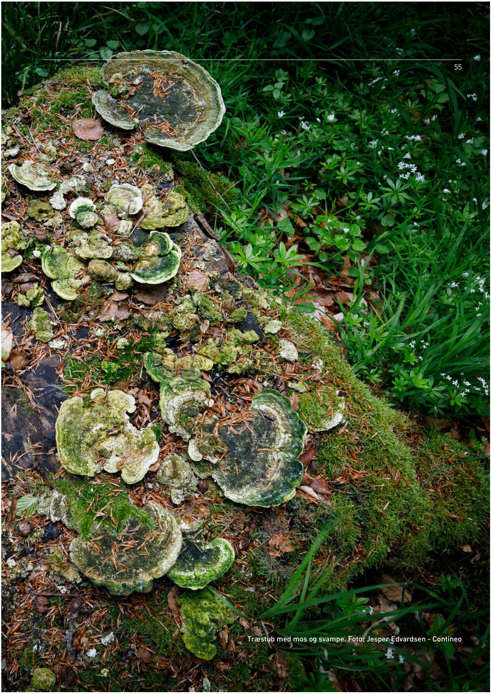
Træstub med mos og svampe.