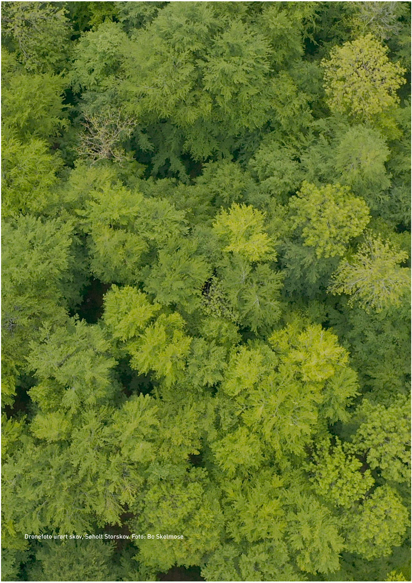
Dronefoto urørt skov, Søholt Storskov.