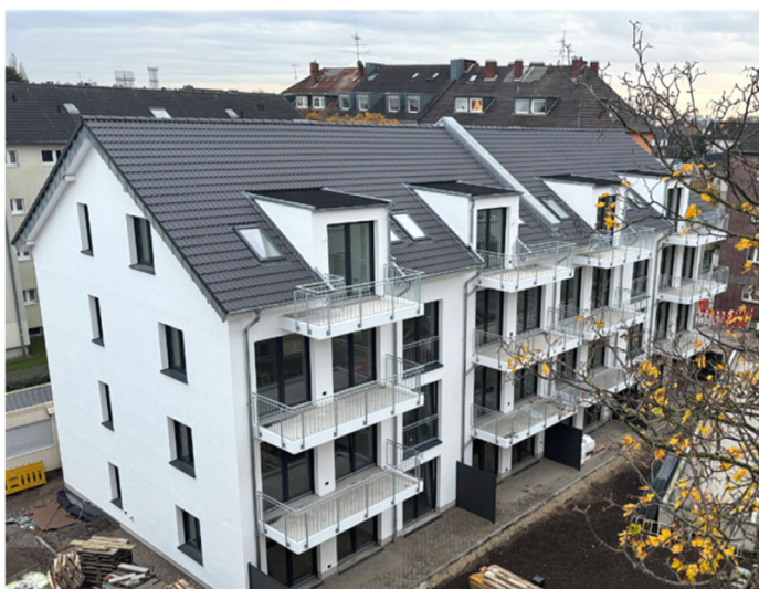
Nybyggeri Nienburger Strasse 2-4, Düsseldorf

Årsrapporten er fremlagt og godkendt på selskabets ordi- nære generalforsamling den 17/5 2024