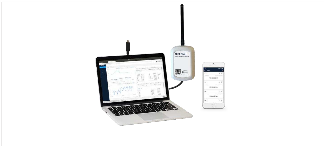
Figur 4: SLX DI4U fjernaflæser SmartMeter og giver indsigt i forbrugsdata

Seluxit har i 2019/20 ydet en målrettet indsats inden for Smart Meter segmentet, med fokus på fortsat drift af eksisterende løsninger og kunder, samt undersøgelser af nye muligheder inden for Smart Meter teknologien, der kan øge fleksibiliteten og kompatibiliteten med andre produkter. Som et resultat af dette, har vi udviklet et nyt standardiseret radiomodul, der kan integreres i de fleste elmålere, og som i modsætning til andre ikke er teknologisk "låst" til en konkret kommunikationsstandard, men som kan kommunikere med forskellige trådløse standarder.