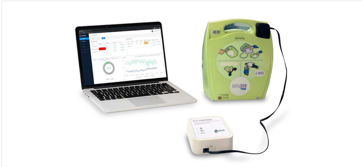
Figur 3: SLX Heartbeat til overvågning af om Hjertestartere

Et andet eksempel er SLX Heartbeat , en helstøbt løsning fra enhed til brugergrænseflade, der er kernen i det produkt, som vi har leveret til Hjerteforeningen i Danmark - og som vi påtænker at rulle ud i de andre nordiske lande i løbet af det næste år.