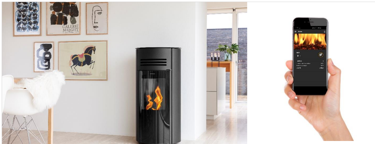
Figur 5: Træpilleovn, der betjenes via App og serviceres ved hjælp af Dashboard data

Løsningen bliver lanceret i efteråret 2020 og vil kunne købes i byggemarkeder og pejsebutikker.