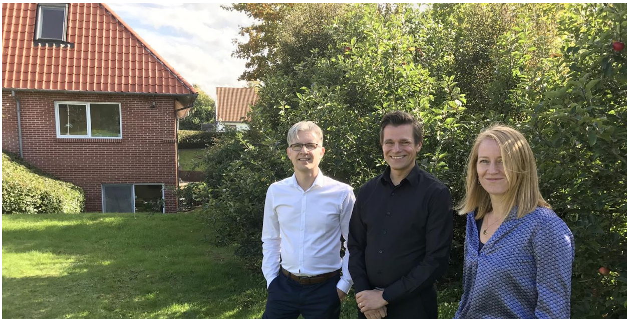
Figur 1: Ledelsen i Seluxit foran den nye kontorbygning i Aalborg

COVID-19 krisen har dog også vist, hvor vigtig digitaliseringen er. De virksomheder, der har indrettet sig på en digital virkelighed, har typisk klaret sig bedst igennem krisen. Når vi kigger mod fremtiden, er vi ikke i tvivl om, at IoT kommer til at gøre en kæmpe forskel for både individer, virksomheder og samfundet. Ligesom mange andre innovative og målbevidste virksomheder verden over, er Seluxit med til at skabe en bedre fremtid.