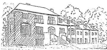
LENE HØJ LARSEN