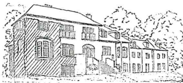
LENE HØJ LARSEN