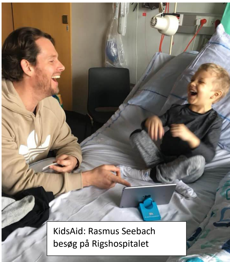
KidsAid: Rasmus Seebach besøg på Rigshospitalet

KidsAids primære formål er at skabe Unikke Oplevelser for syge og sårbare børn og unge i Danmark.