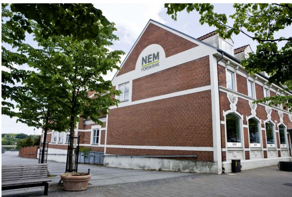
NEM Forsikring A/S – Adelgade 92 – 8660 Skanderborg – CVR-nr. 24 25 63 83

For perioden 1.januar - 31.december 2017