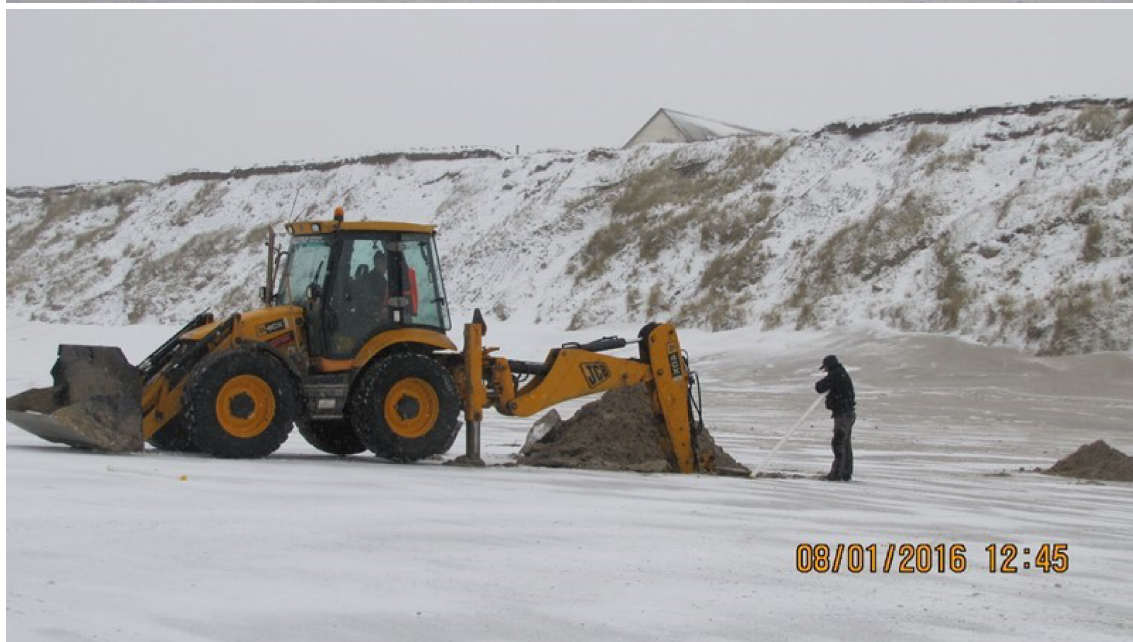
Vi ser installationen ved Svanevej i Fureby d. 8 januar 2016