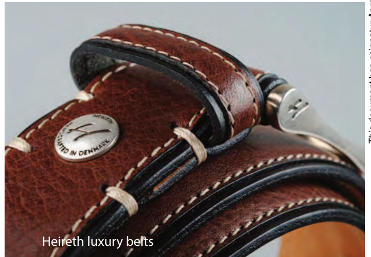
Heireth luxury belts