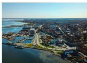
Forlænget rammeaftale med to større kunder og vundet rammeaftale med en ny kommune.