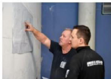
Reorganisering og samling af vores serviceafdeling indenfor både VVS og EL, så vi kan yde en tværfaglig service.