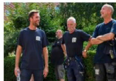
Oprettelse af en ny tværfaglig projektafdeling til mellemstore projekter, som vores relationskunder efterspørger.