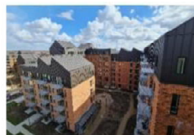
Afslutning af teknisk entreprise på byggeriet af 700 boliger i Brøndby.