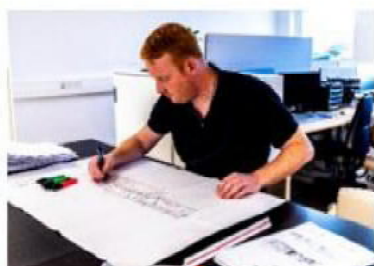
En styrket kalkulationsafdeling med kompetencer indenfor både VVS og ingeniørfaget.