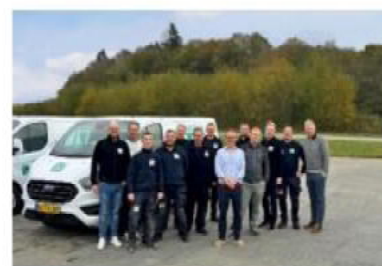
Opstart af ny afdeling i Kolding til landsdækkende service.