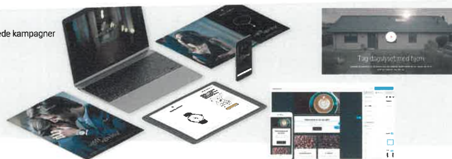
Digitalt integrerede kampagner