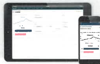
Omnichannel POS løsninger