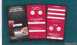
Nordlid er nummer 1 til at skabe resultater Udvikle digitale løsninger Analyser og anvende data