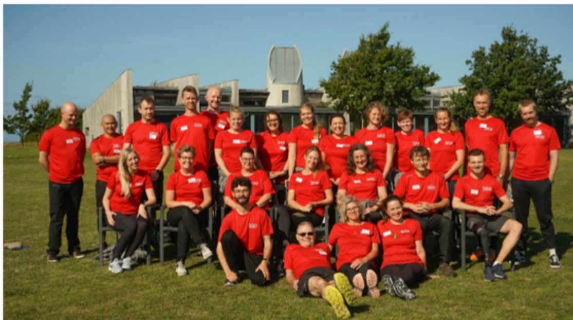
Fig. 1: Sahva-medarbejdere på Løbescule 2021

Vi har en målsætning om kontinuerligt at højne medarbejdertilfredsheden i Sahva. Derfor får vi hvert andet år udført medarbejdertilfredshedsundersøgelser i organisationen. Den seneste undersøgelse er foretaget primo 2022 og resultatet omtales nedenfor.